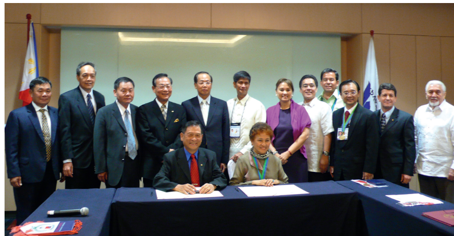
第二、三屆秘書長交接，第一屆秘書長觀禮。

此行中華台北監督委員與菲律賓監督委會代表簽定Memorandum of Understanding，圓滿達成任務。（趙怡貞）